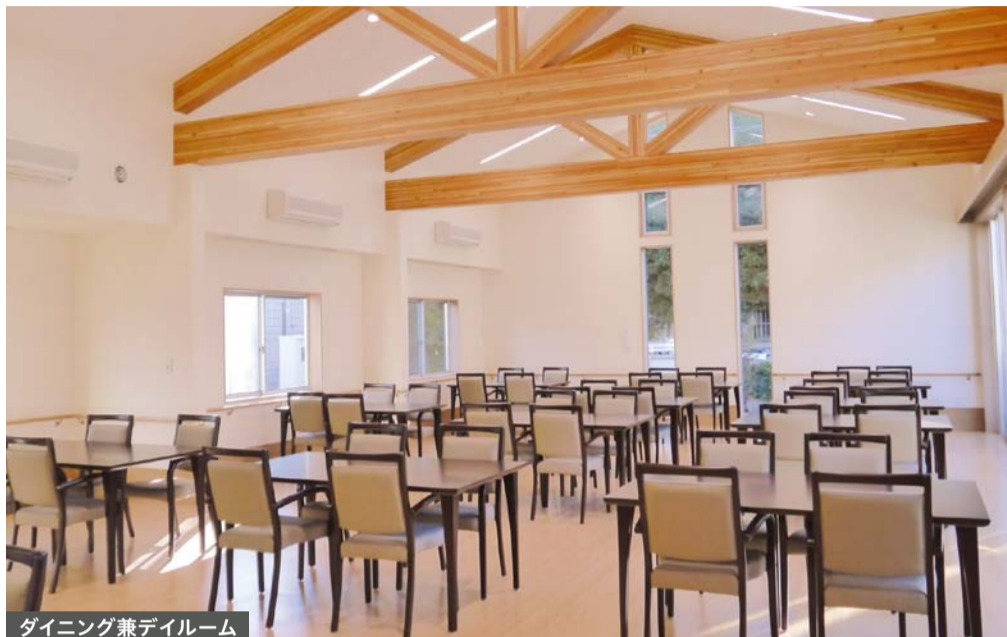
ダイニング兼デイルーム