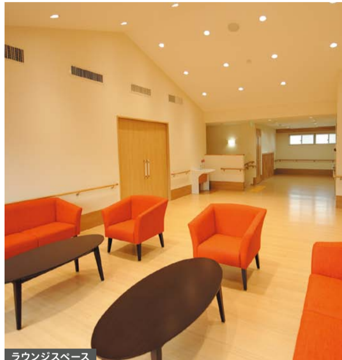
ラウンジスペース

ゆったりと過ごせるラウンジスペース、相談室、静養室と、トレーニングルームを完備。ご利用者の身体状況に合わせてマシンを利用したトレーニングが可能です。