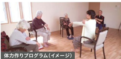
体力作りプログラム(イメージ)

ソルシアス上用賀のサービスコンセプトは「Wellness&Culture」。専任講師によるヨガレッスン、マッサージ、ストレッチや、高齢者体力づくり支援士監修による体操プログラムなどにご参加いただける「Wellness」。そして各分野の専任講師によるフラワーアレンジメント、フィットセラピー、お菓子教室、メイクレッスン、ネイルなどをお楽しみいただける「Culture」をご提供しております。